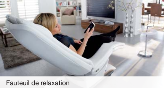
Fauteuil de relaxation