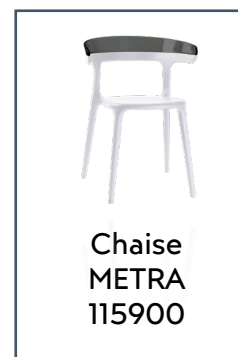
Chaise METRA 115900