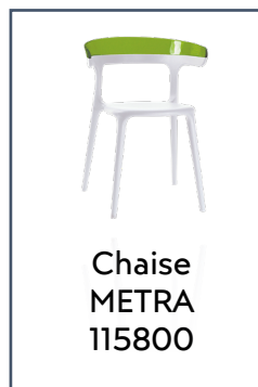
Chaise METRA 115800